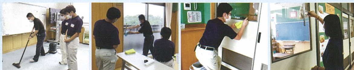
ビルクリーニング講習を受けたあとの生徒たちの姿

生徒たちは、どうしたら窓がきれいになるのか考える姿が見られました。スクイジーの使い方では、腕だけでなく体全体を動かすことを意識していました。窓をきれいになりたいという気持ちが強くなったように思います。ご指導ありがとうございました。（西郷支援学校）