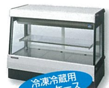
冷凍冷蔵用 ショーケース