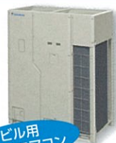
ビル用 マルチエアコン