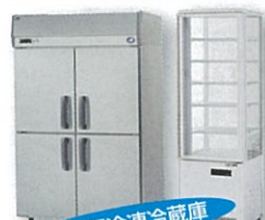
業務用冷凍冷蔵庫