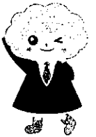
パートタイム・有期雇用労働法 キャラクター「パチウ」ちゃん